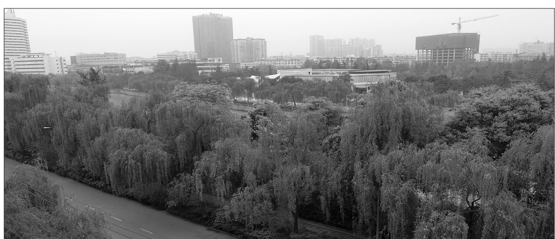
“绿色”的东较场社区环境非常优美