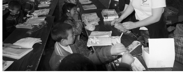
志愿者在给小学生分发文具

一个月前,凉山州喜德县西河乡书口小学23名学生的生活现状被发到网上。这个原本非常普通的帖子,但却打动了众多成都网友的心。