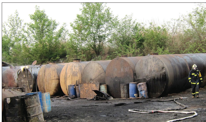
发生有毒气体泄漏的工厂

昨日11点30分左右,成都温江区永盛镇金马河的一个废机油回收厂内突然冒出冲天黄烟。附近居住的居民开始闻到扑鼻臭味,直感头晕呕吐。 成都消防迅速调集防化处置人员赶赴现场,采取喷水稀释、罐体降温、“柔性覆盖”等措施处置险情。3100人紧急疏散。温江应急办表示,泄漏的是含苯和氯等成分的有毒气体。相关责任人已被控制。