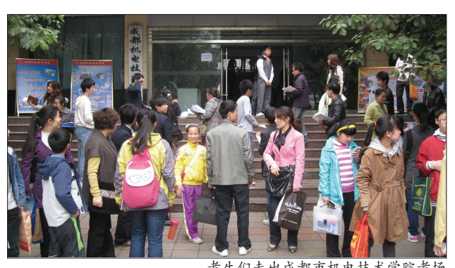
考生们走出成都市机电技术学院考场

华西都市报(记者吕甲)近日,由四川省新闻工作者协会评选的2010年度四川新闻奖摄影类出炉,共评出20件获奖作品,其中华西都市报记者有6件作品获奖,获奖数量和质量名列各家媒体前茅。华西都市报首席记者朱建国拍摄的《无线上培训 10岁女孩路灯下练习芭蕾》获得组照类一等奖。摄影部主任谭曦独获四奖,其中《四川监狱首练瑜伽》获得单幅类一等奖,《隐居雨市的武僧》获得组照类二等奖,《一辆秸秆能卖七八十元 农民们笑弯了》和《成都地铁诞生记》获得组照类三等奖。记者吴小川拍摄的《风雪路》获得单幅类三等奖。