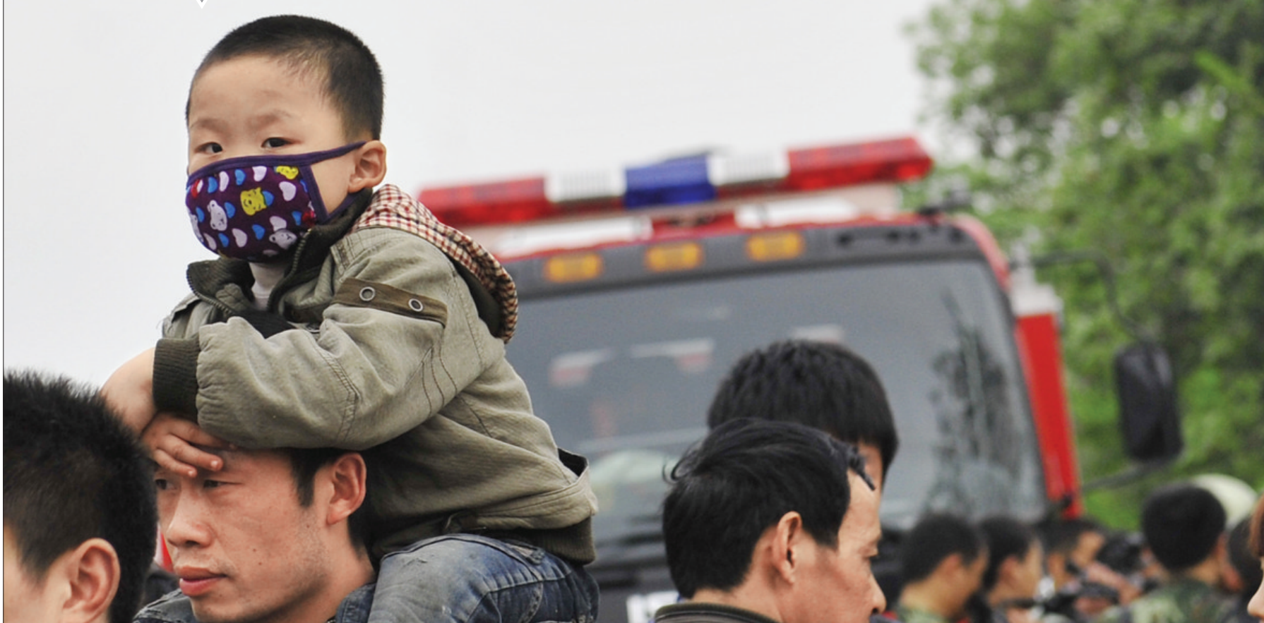
工厂周围的小朋友戴上口罩防毒气