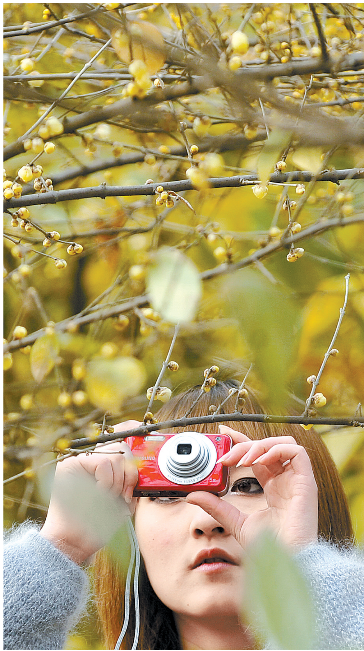
蜡梅开了,市民可趁元旦小长假赏花去