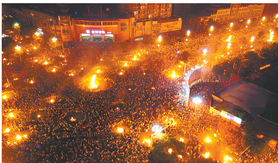
西昌市长推荐航天大道