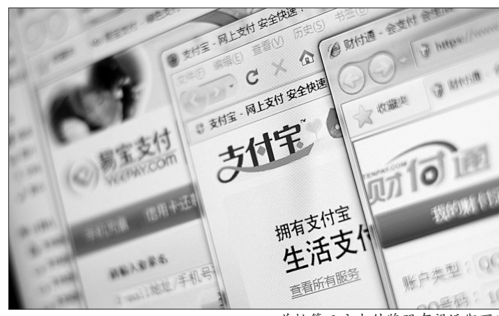
首批第三方支付牌照有望近期下发

去年4月在央行报备申请牌照的130多家企业中,有17家进入央行公示程序的申报企业,分别是北京6家,上海6家,深圳2家,杭州、广州、海南各一家,其中银联系各有4家。首批第三方支付企业“正规军”将从中诞生。