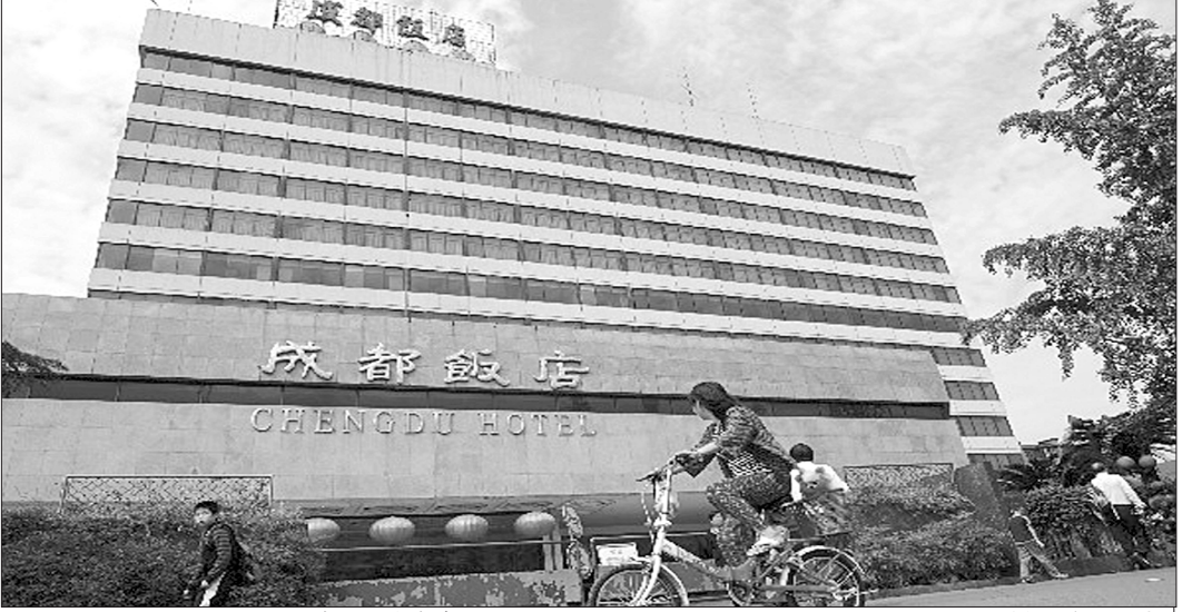
成都饭店未来有可能打造成星级酒店+购物+写字楼的大型综合物业

或是四川建设发展股份有限公司和四川洋洋百货股份有限公司,这两家公司存在控股关系,为母子公司