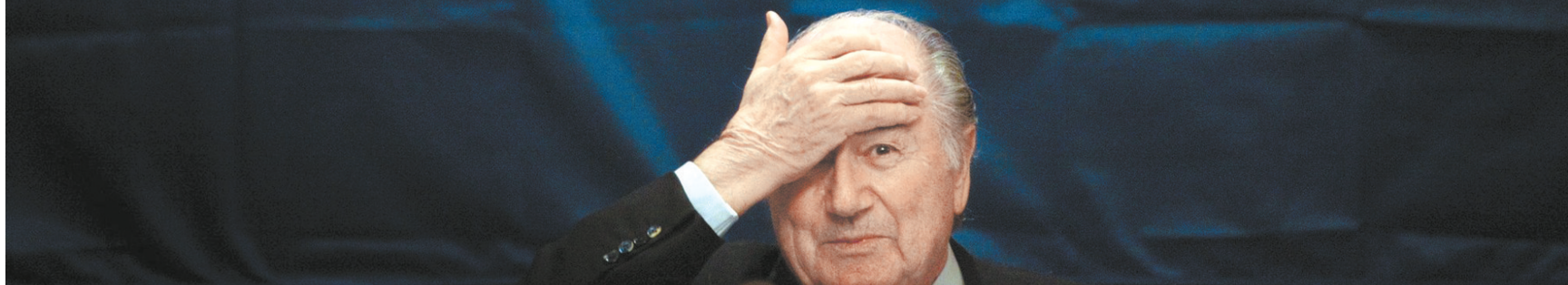
FIFA老大,当起确是舒服

乱成一锅粥的世界杯申办已经让国际足联的威信几乎跌到历史最低点,尤其是国际足联主席布拉特更被人们指责为“金钱的奴隶”。不管外界反对的呼声如何,这位74岁的老头显然还想着手里这个肥缺,要知道国际足联目前的储备资金已经超过了10亿美元。昨天,布拉特在国际足联官网公开发表了自己的竞选连任计划,从明年一月开始,这位大佬将展开自己的全球拉票计划。