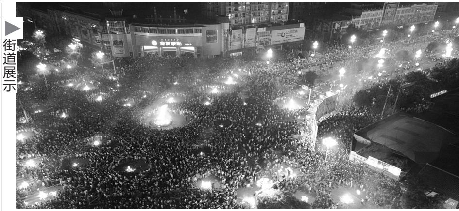
航天大道的火把节之夜

提醒 前去“验货”的读者,千万别忘了拍回美美的照片上传到腾讯大成都网“最美街道评选”首页或微博,让大家也看看,哪些街道是凭实力说话,哪些街道是在忽悠人。你的照片很可能就是最终评选的依据哦! 华西都市报见习记者 吴翠峰