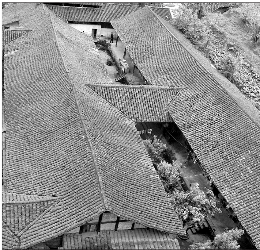
古色古香的小青瓦四合院