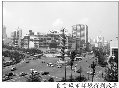
自贡城市环境得到改善

城市园林绿化建设方面,政府实施了39条道路绿化和70个城市重要节点绿化打造,153个园林绿化栽植乔木、灌木及地被植物近1000万株,草坪40余万平方米,全