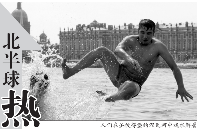
北半球热死 人们在圣彼得堡的涅瓦河中戏水消暑

今年入夏以来历史罕见的高温天气给俄罗斯带来又一条令人悲伤的新纪录:19日一昼夜,全国71人因游泳溺亡。