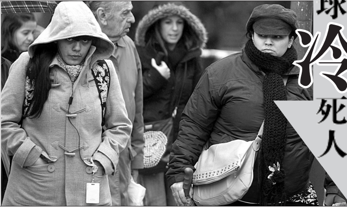
19日,人们身穿冬装走在布宜诺斯艾利斯街头