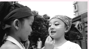
比赛之前小朋友互相化妆

五朵“粉红色小花”在舞台上绽放，舞蹈动作完全自编自导；伶牙俐齿的胞胎兄弟，扮演“猫鼠兄弟”，惟妙惟肖讲故事；还有众多小宝贝高胆大秀才艺，展歌喉。昨日，本报主办的“社区时尚宝贝秀”走进华润翡翠城，70多位宝贝带来了各具特色的舞蹈、器乐演奏、诗歌朗诵及T台走秀等表演。