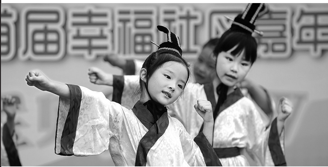
小朋友表演《弟子规》

五朵“粉红色小花”在舞台上绽放，舞蹈动作完全自编自导；伶牙俐齿的胞胎兄弟，扮演“猫鼠兄弟”，惟妙惟肖讲故事；还有众多小宝贝高胆大秀才艺，展歌喉。昨日，本报主办的“社区时尚宝贝秀”走进华润翡翠城，70多位宝贝带来了各具特色的舞蹈、器乐演奏、诗歌朗诵及T台走秀等表演。