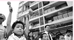
小朋友在台下为选手加油