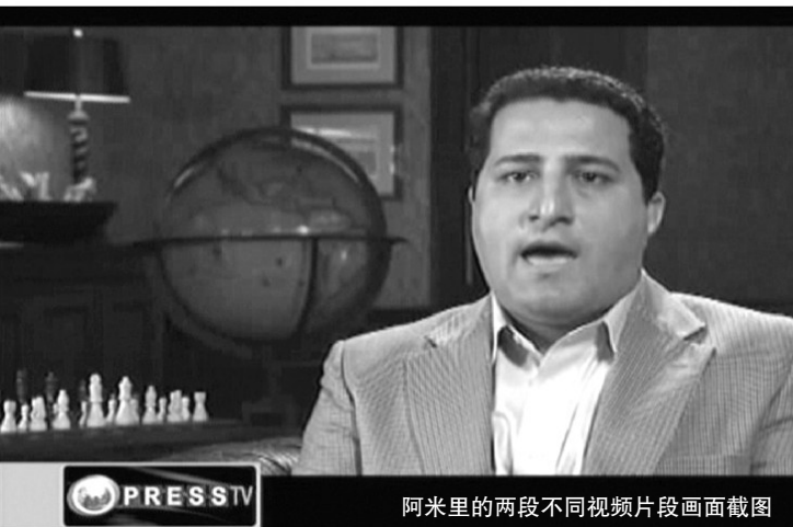
Amiri's two different video clips side-by-side screenshot