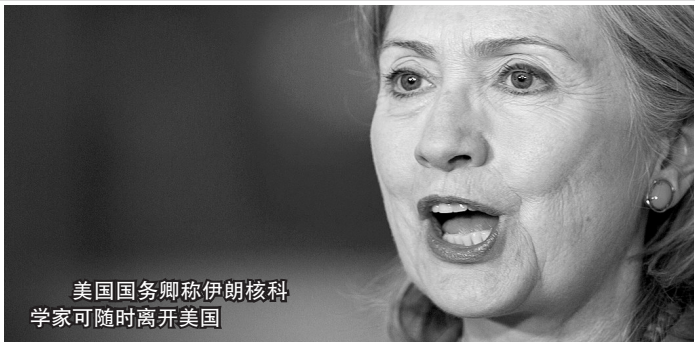
美国国务卿称伊朗核科学家可随时离开美国