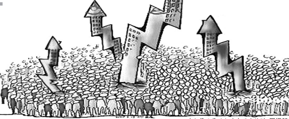
房租暴涨导致租房者压力倍增

据链家地产市场研究部统计,2008年北京市平均的租赁价格为2490元,2009年平均租赁价格为2547元,租赁价格小幅上升2.3%,而2010年前6个月,北京市平均的租赁价格为2928元,比2009年上升15%,特别是5月、6月间租金上飙升惊人,据统计,今年5月、6月,北京平均的租赁价格为每月3000元,同比