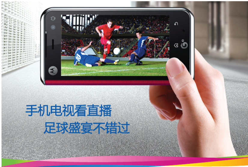
手机电视看直播 足球盛宴不错过

笔者在调查中发现，不少出租车司机都或多或少听说过手机电视，但很少真正去体验手机电视的效果，但他们对手机电视的评价无一