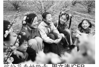
缤纷花香好踏青