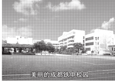
美丽的成都铁中校园

必须通过学校的考查,并由学校高考领导小组进行考评,凡不合格者,不能担当高三教学工作;若有对学生关爱不够或是学生和家长反响强烈的教师,经学校高考领导小组考评之后认为其确实不能胜任本职工作,学校也坚决予以撤换;另外,学校还大胆启用优秀青年教师,新老搭配,进一步充实高三教师队伍,规避知识老化的风险。