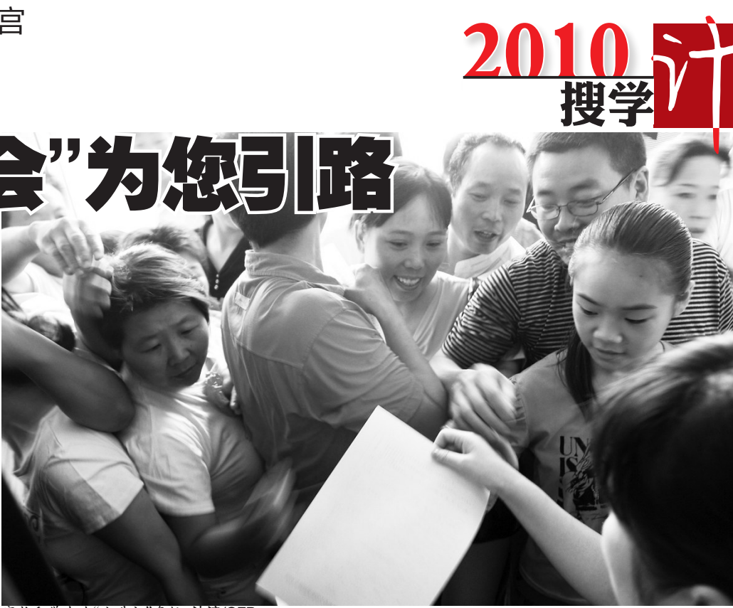
家长和学生在“小升初”升学会上忙碌