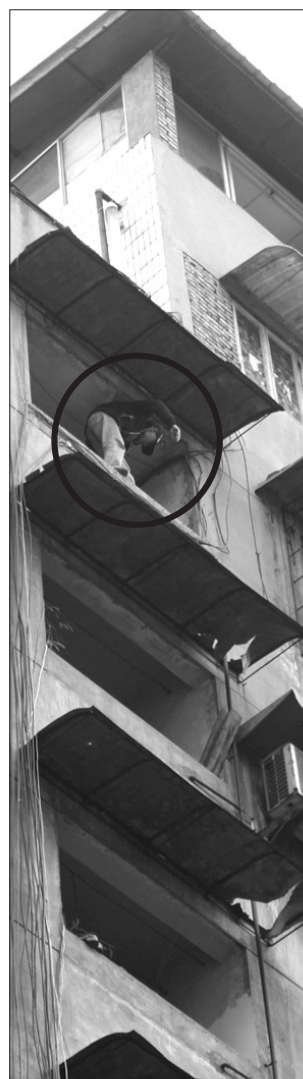
图中人威胁要跳楼

昨日中午12点左右，宜宾城区鲁家坝社区。一名男子爬上当地一栋高楼的9楼阳台护栏上，扬言要跳楼。