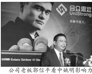
合众思壮 UniStrong 形象代言人 公司老板郭信平看中姚明影响力