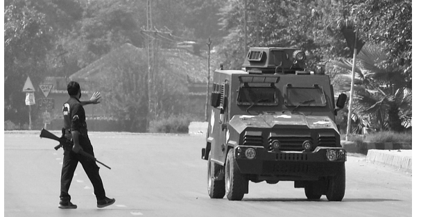
巴警方车辆在发生枪战的地点附近巡逻

巴基斯坦西北部地区开一普省首府白沙瓦28日清晨发生枪战,地点为美国领事馆和巴基斯坦军方办公楼所在区域。军方随即封锁这一区域。警方声称武装人员从军方办公楼外部发动袭击。军方则称,两名在押人员接受访问时夺过两名警卫手中武器,把他们挟持为人质,引发双方交火。